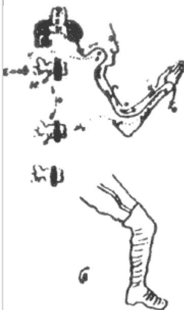
Схема действий нервов руки

Под влиянием этой идеи приходит в действие воля, и из П. Г. М. отправляется импульс в руку по проводнику Д. Г., в силу чего эта рука поднимается высоко в воздух, таким образом, сознательное действие воли значительно усиливает эффект первого движения.