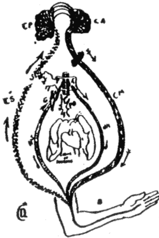
Схема нервной системы руки